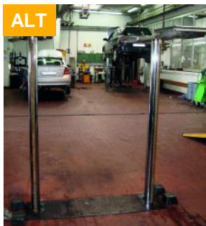
Neue Flachträger-Hebebühne in bestehende Einbaukassette, ohne Bauarbeiten

Tauschen Sie jetzt Ihre alte Hebebühne, der Einbau erfolgt in Ihre bestehende Einbaukassette.