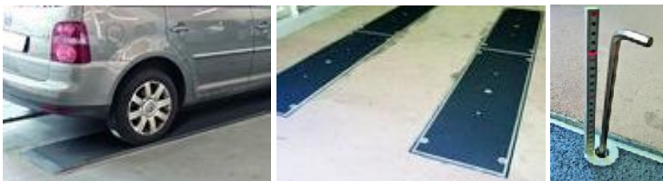
Nivellierbare Prüfplatten in modularer Bauweise für verschiedene Fahrzeuglängen Einbau bodeneben oder kostengünstig bodenauflegend ohne Bauarbeiten möglich

Zur Erfüllung der neuen gesetzlichen Anforderungen bieten wir verschiedene Möglichkeiten zur praktischen Umsetzung