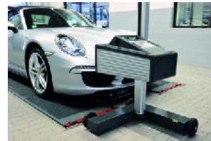
Verwendung einer nivellierten Achsmess-Hebebühne